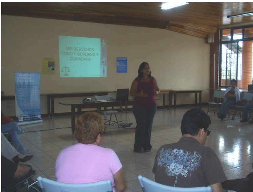
Taller Exigibilidad de derechos