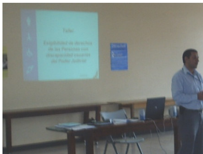
Exposición del representante de la Contraloría de Servicios

A los asistentes se les explicó el objetivo y funciones de la Contraloría de Servicios, además, se informó los mecanismos existentes para tener acceso al servicio.