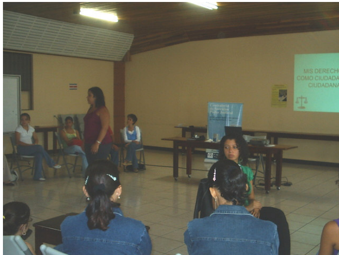
Exposición del CNREE

hicieron dinámicas donde los y las asistentes manifestaron los derechos que consideran más importantes.