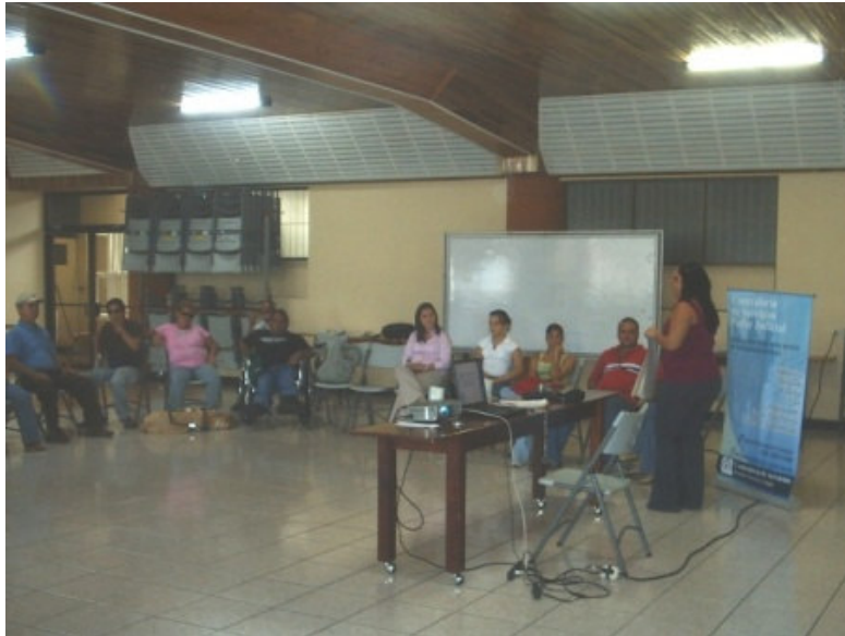
Invitados a la actividad