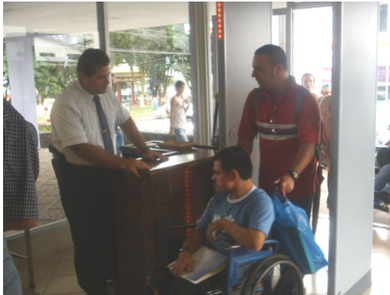
Ingreso de persona en silla de ruedas a los Tribunales de San Carlos

La actividad finalizó con la visita de las personas con discapacidad a la oficina de la Contraloría Regional de Servicios de San Carlos.