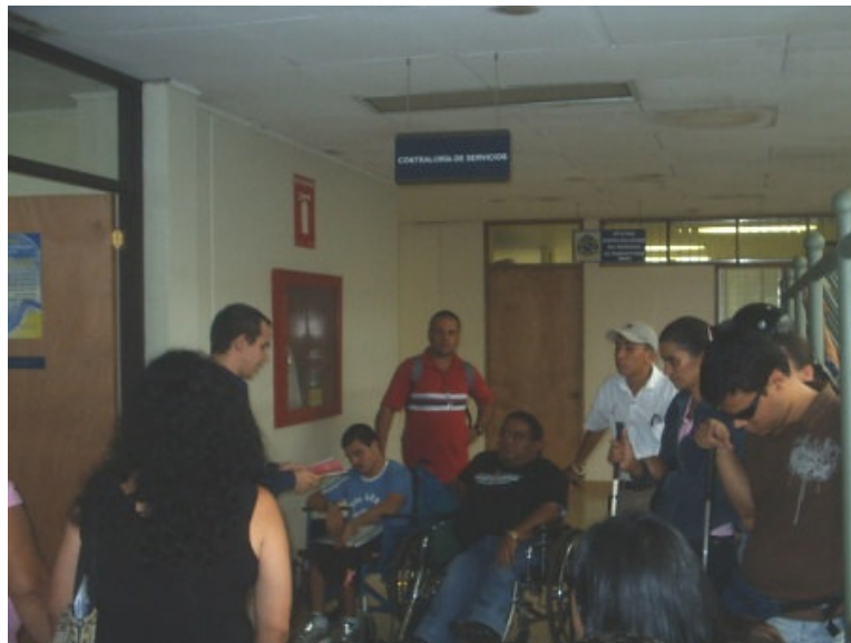
Personas con discapacidad en la Contraloría Regional de Servicios de San Carlos

La actividad finalizó con la visita de las personas con discapacidad a la oficina de la Contraloría Regional de Servicios de San Carlos.