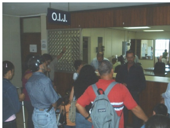
El Jefe del OIJ explicando la función de la oficina

Durante el recorrido un funcionario de cada oficina judicial, explicó a los asistentes la función y asuntos que se tramitan en el despacho.